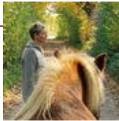
von Claudia Annighöfer

Ein Gefühl dafür zu bekommen, wie dein Freund in Tiergestalt die Welt sieht, bietet die Chance auf Entwicklung und Veränderung.