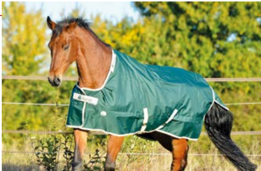
oben: Wie die ecke richtig sitzt – unten: Endlich ohne Decke

Oftmals sind die Decken über den Winter zu eng geworden, wenn das Tierchen zu viel Winterspeck entwickelt hat. Oder sie waren von Anfang an zu groß, ihr wisst ja, die Decke soll in Richtung Kopf eures Liebling vor dem Widerrist liegen.