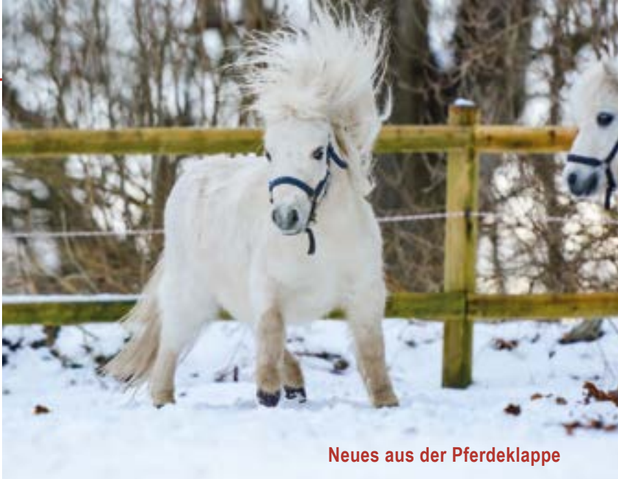
Neues aus der Pferdeklappe