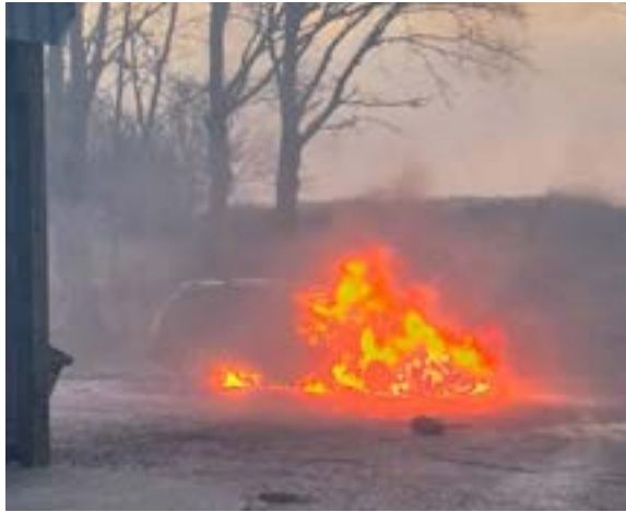
Unser geliebtes Auto brennt

Dann wurde es wieder spannend, denn wir durften immer mit auf Autosuche gehen. Ein lieber Freund von Frauchen ist andauernd mit uns losgefahren, irgendwelche Autos in fremden Städten anzuschauen. Nach nur vier Tagen fanden wir den Richtigen: Er ist fast genauso wie der Alte, nur viel jünger. Großartig! Ich liebe es, Auto zufahren.