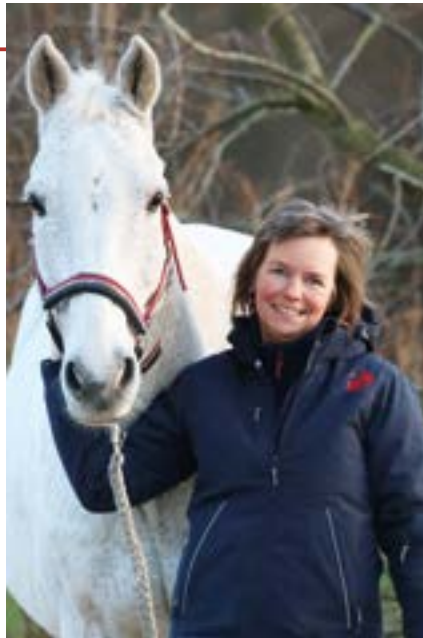
von Sandra Gärtner

Jedes Tier ist einzigartig, jedes Tier hat Wünsche und Bedürfnisse, jedes Tier hat eine Geschichte. Es liegt an uns Menschen, ihnen gut zuzuhören. Denn wenn du wirklich in Verbindung mit ihnen bist, öffnen sie ihr Herz und zeigen uns ihre Einzigartigkeit!