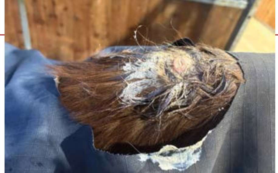
Leider kommt es mitunter zu solchen Verletzungen, wenn die Decke nicht richtig sitzt oder von innen beschädigt ist